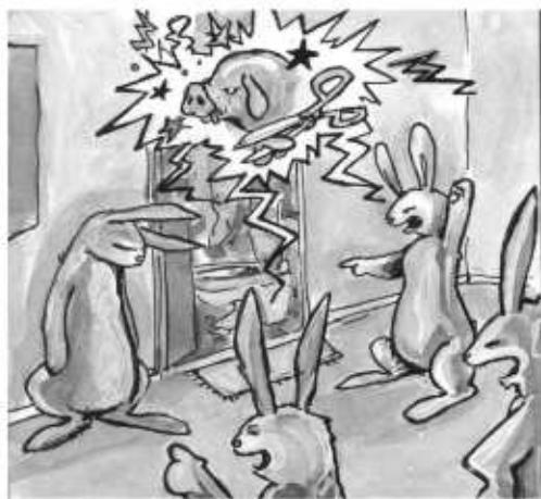
"...et puis on m'a expliqué..."