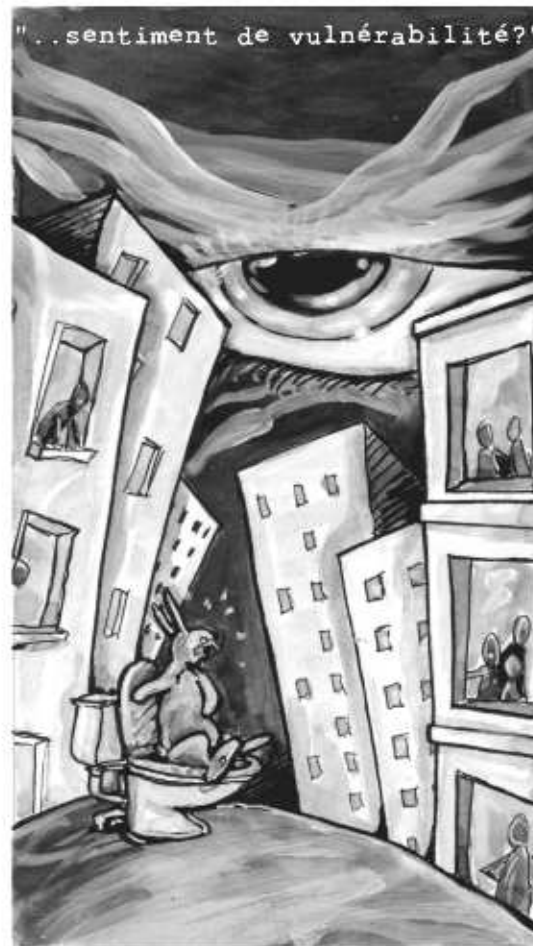
"...en fait en essayant on comprend très vite pourquoi il vaudrait mieux que chacun s'assoie..."