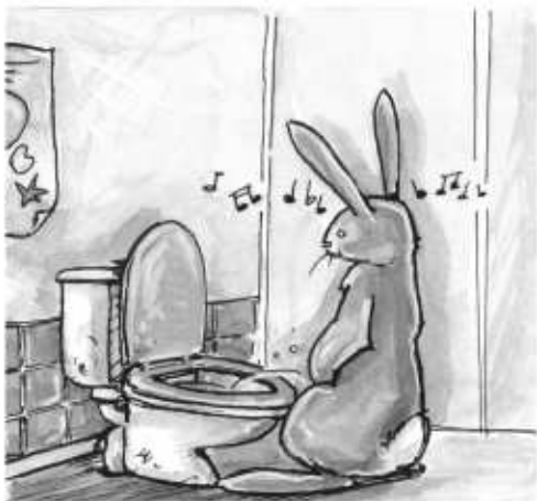
"Avant je pissais toujours debout..."