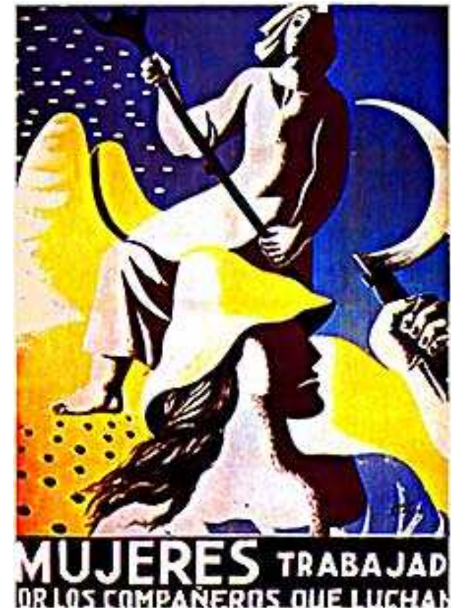
«Femmes, travaillez pour ceux qui luttent» Affiche de la guerre civile d'Espagne